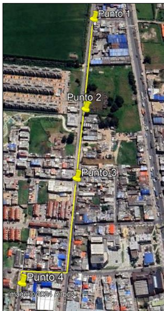
Ilustración 1. Recorrido verificación ambiental

Con base en lo anterior, el día 04 de diciembre de 2024 se realizó recorrido de control y vigilancia en el barrio La Aurora desde las coordenadas 4°43'7,704"N- 74°12'7,596"W hasta las coordenadas 4°43'3,774"N- 74°12'27,33"W (ver ilustración 1. Ruta amarilla).